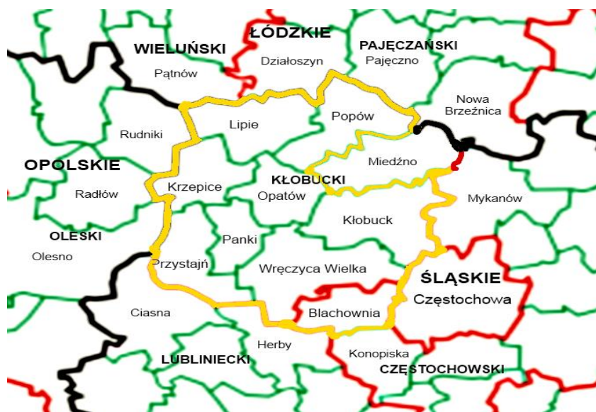
Rys 1. : Spójność terytorialna obszaru LGD

Według danych GUS na 31.12.2020 całkowita liczba ludności oddziaływania LGD Zielony Wierzchołek Śląska to 88 609. Powierzchnia obszaru LGD Zielony Wierzchołek Śląska to 842 km 2 . Liczba zameldowanych mieszkańców